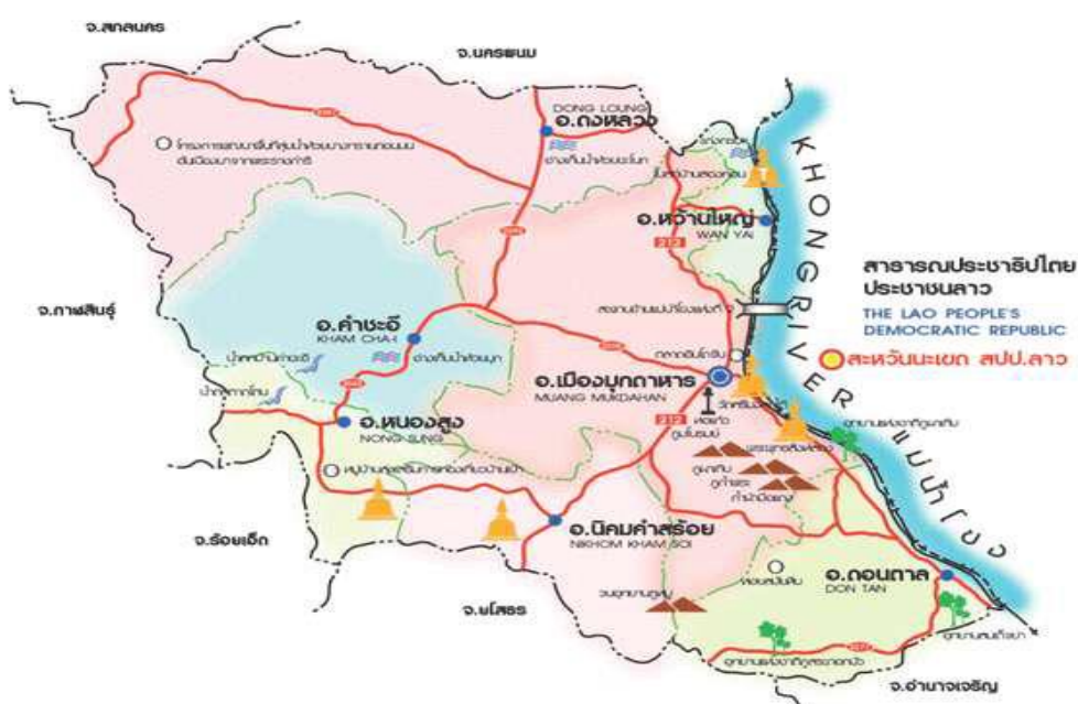
รูปที่ 1.1 แผนที่จังหวัดมุกดาหาร

จังหวัดมุกดาหาร มีพื้นที่ทั้งหมด 4,339.83 ตร.กม. หรือ 2,712,394 ไร่ อยู่ห่างจากกรุงเทพมหานคร 642 กิโลเมตร มีแม่น้ำโขงเป็นเส้นกั้นพรมแดนระหว่างประเทศ ความยาวประมาณ 72 กิโลเมตร โดยตั้งอยู่ ตรงข้ามเมืองของ สปป.ลาว ได้แก่ อำเภอเมืองมุกดาหาร ตรงข้ามเมืองโกสอนพมวิหาน แขวงสะหวันนะเขต อำเภอหว้านใหญ่ ตรงข้ามเมืองไชยบุรี แขวงสะหวันนะเขต อำเภอดอนตาล ตรงข้ามเมืองไซพูทอง แขวงสะหวันนะเขต ซึ่งมีอาณาเขต ติดต่อกัน ดังนี้