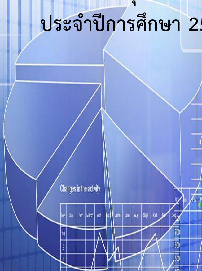
Changes in the activity